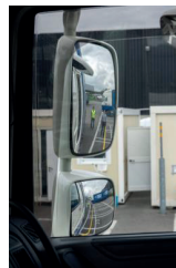
Dode hoek spiegel